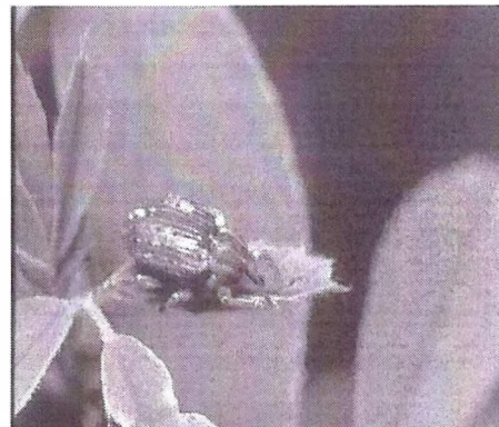
gargarita frunzelor de lucerna

Pentru prevenire și combatere se recomandă se recomandă executarea tratamentului numai pe parcelele pe care s-au realizat următoarele condiții :