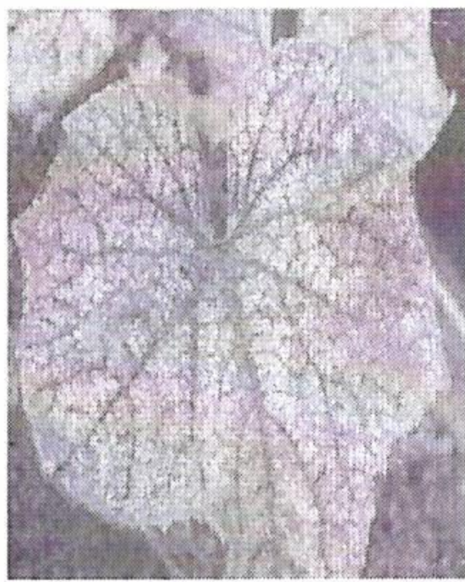
Păianjenul rosu comun